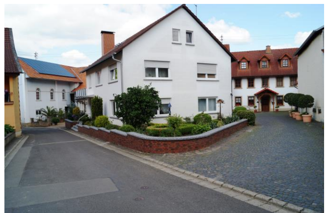
Auch bei der Führung von Heimatforscher Rainer Thielen durch den Ort gab es Sehenswertes zu bestaunen.