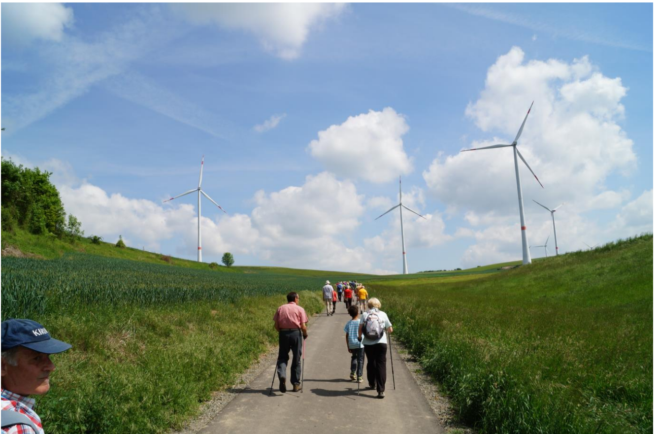
15 Windräder stehen auf der Gemarkung von Rehborn. Das gibt Geld !