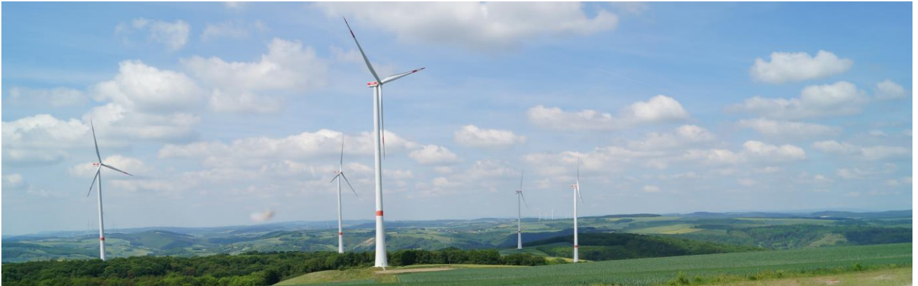
Laute Windgeräusche und tote Vögel hörte bzw. sah man nicht.