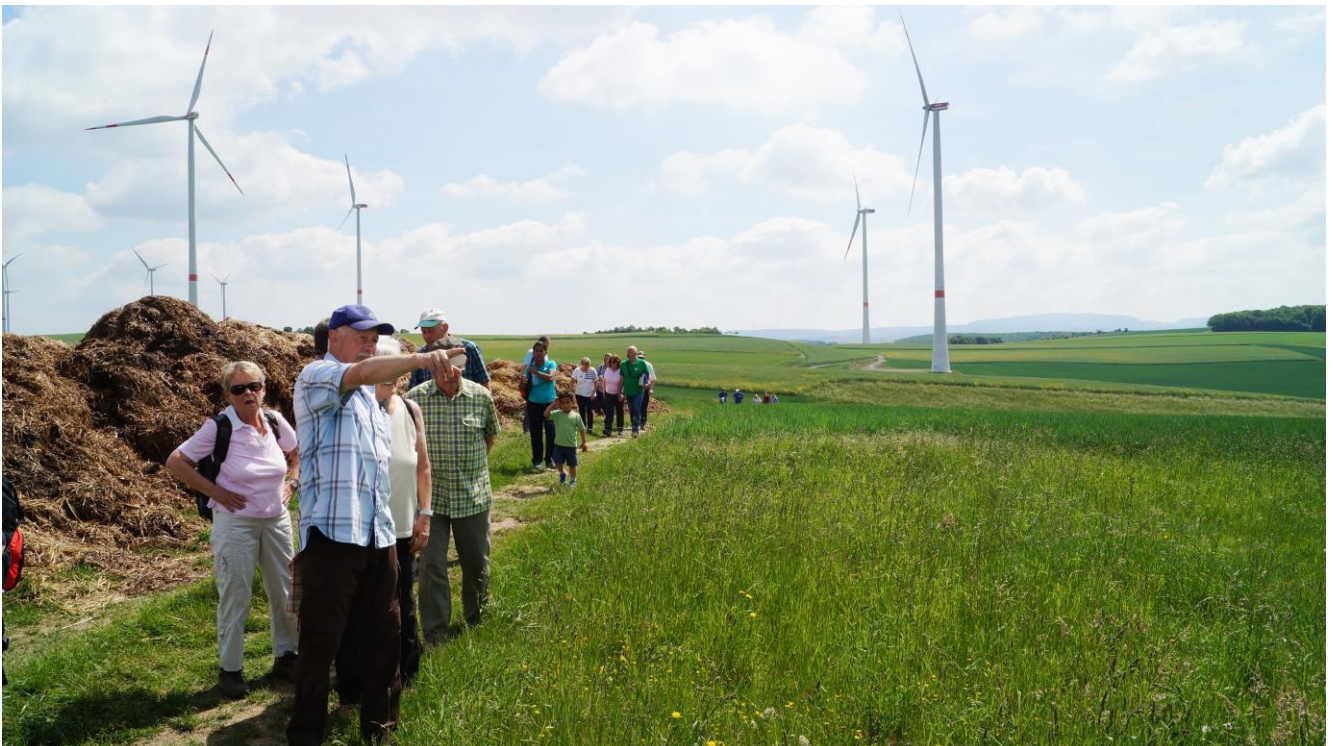
Doch eines konnte man deutlich sehen: „Es wird auch viel Mist darüber geredet !“