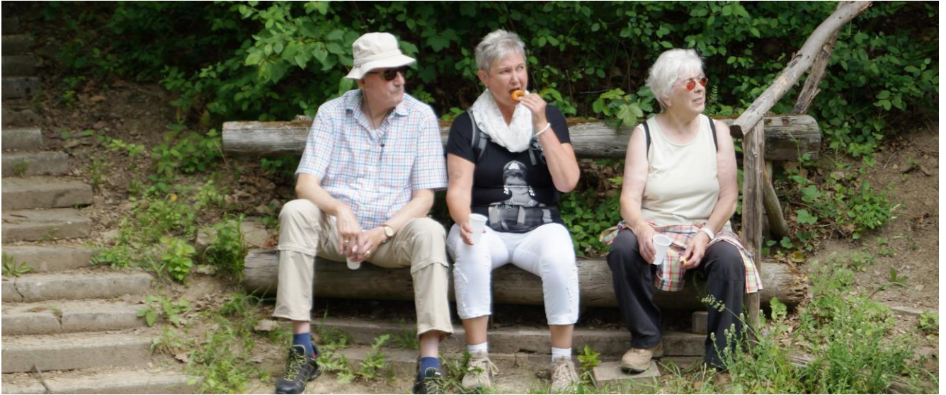
So lässt sich die kurze Rast gut überbrücken.