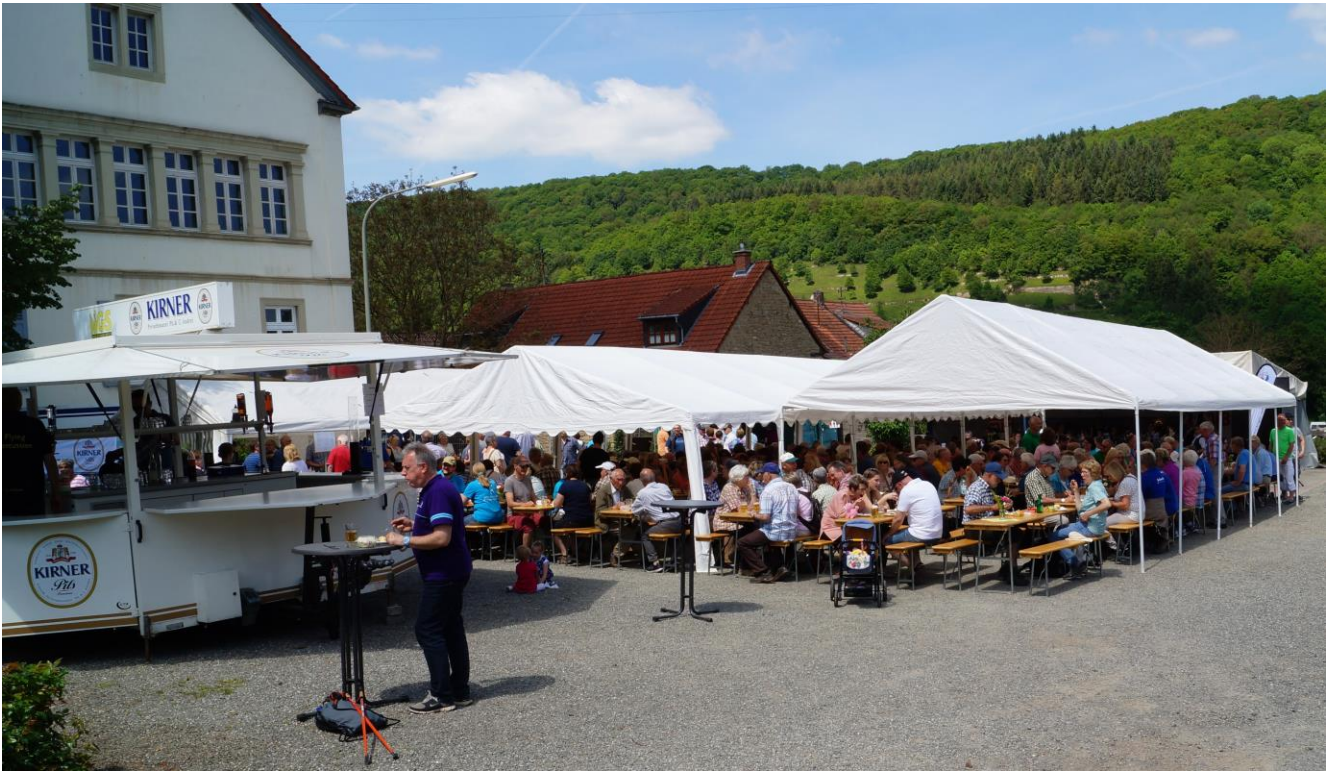
Der Turnplatz in Rehborn war bis auf den letzten Platz gefüllt. Der Veranstalter musste sogar noch rechts neben dem Zelt zwei Reihen Garnituren aufstellen.