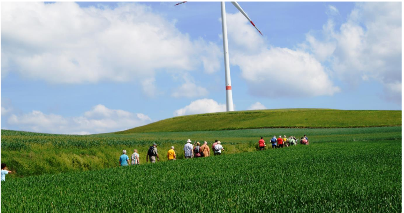
Doch halt: „Das Gras und die Frucht hörte man wachsen !“