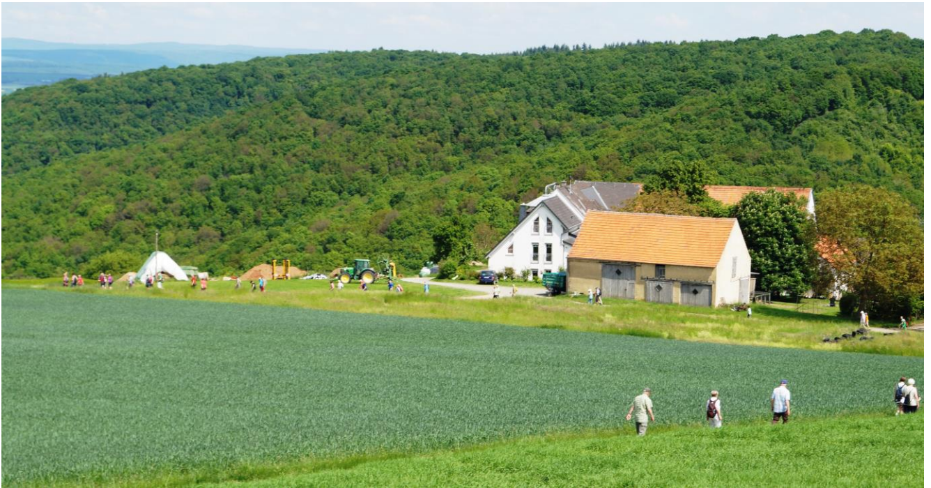
Die Wandergruppe hatte sich sehr weit auseinander gezogen als die Strecke am Einsiedlerhof vorbei ging.