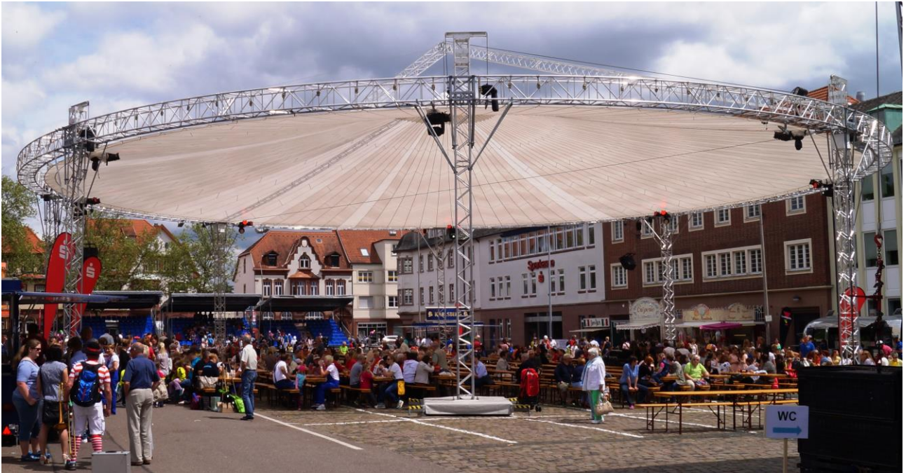
Ein herrliches Zeltdach über den Marktplatz in St. Ingbert bot den zahlreichen Besuchern reichlich Schatten bei den sommerlichen Temperaturen.