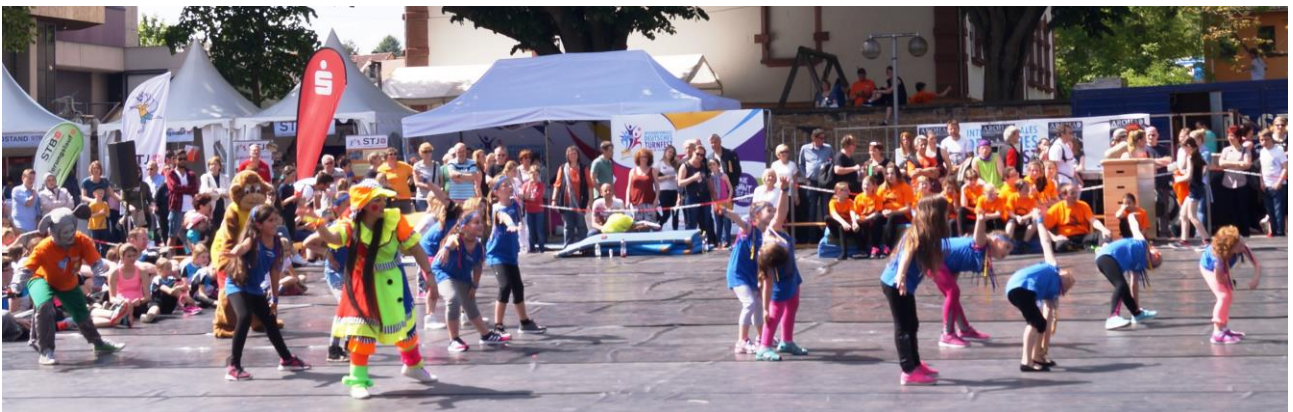
Für farbig frohe Bilder, sorgten die Kids bei ihren Vorführungen auf der großen Tanzfläche vor der Tribüne.