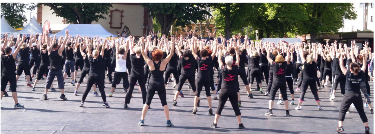
Auffällig war die große Anzahl der Damenwelt, welche sich fit halten. Die Herren dagegen trimmten ihren Bauch mit Bier und Wurst.