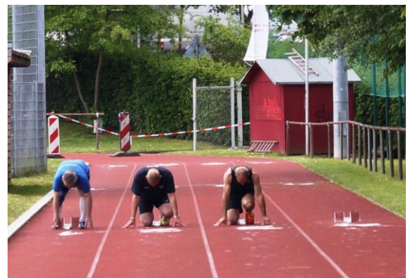
Volle Konzentration beim Start über 50 m