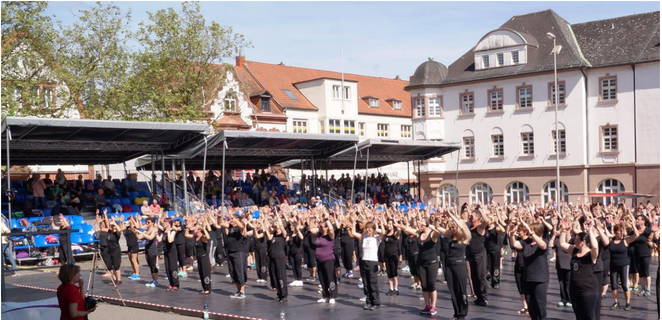
Gemeinsame Fitnessübungen auf der großen Tanzfläche vor der Tribüne animierten zum Mitmachen.