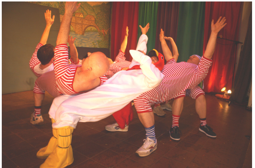
Die Alterturner mit einer sensationellen Übung „Ein freiliegender Ring“