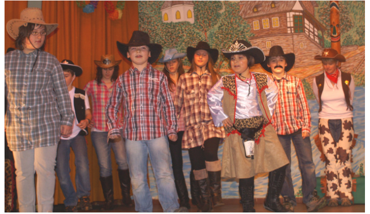
„Cowboys“ The Rope Skipper des TV Hahnenbach